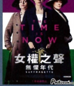
女權之聲 無懼年代