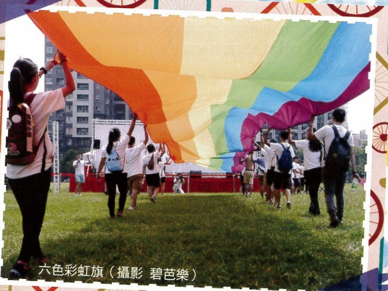
六色彩虹旗