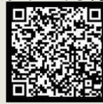
面對情緒行為 影片分享