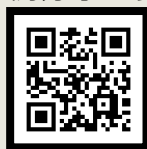
融合教育現場教學手冊 (情障篇)