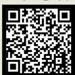
台北市融合教育現場 教學手冊

若您對於特殊生的策略還有更多的疑問，您可參考以下資源及案例分享，更歡迎與資源中心的特教老師共同討論您面對特殊生的困擾。